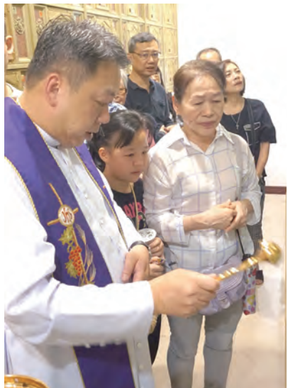
▲全家老少一起追思先人，請求降福。

因著這一層省思，他心中充滿感恩，感謝家人給他最好的禮物，就是信仰！在場的每一位會在清明到此參與聖祭，都是對祖先、家人與親友有著由衷的敬與愛，在愛中，我們了解父母親的無私付出，也感念祖先以聖言教導讓我們的父母親能以信仰愛了我們，而我們今天