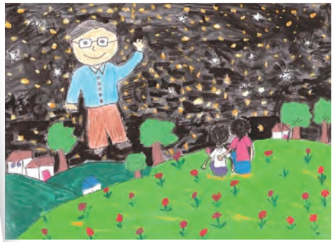
▲國小中年級特優第一名小恩作品