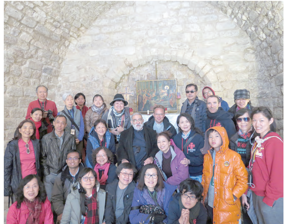
▲納匝肋校長神父談：戰地的族群融合和教育。

從特拉維夫一路南行，沿途風景即從期盼與嚮往的無限風光，急轉至震撼連綿、讓人激動不已的曠野。曠野！聖經中頻頻出現的場景，就在眼前。滿目黃石、岩坵，瀚海綿延，烈陽驕曬，煞是刺眼。這是聖地？水呢？（我想起自來水）能住人嗎？（車行久久也不見城鎮或是村莊）這是吾主誕生人間的家鄉！涸涸乾土、孱孱弱草、蕭蕭瘦樹，這可是天父千挑萬選之地？要說天父慷慨，大概就是那無際無邊的空曠吧！無法抑制的驚嘆，啞然無語。不知是不是盯著車窗外的風景太久，還是那毫無遮蔭的光線太強，眼睛發酸，直想流淚。