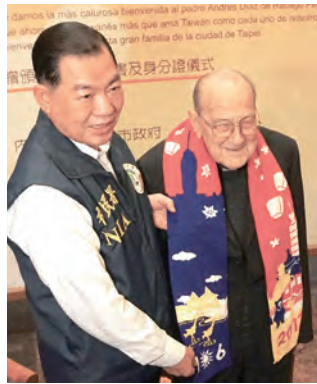
▲移民署何榮村署長為賴神父圍上2017年國旗圍巾，表達賀忱。