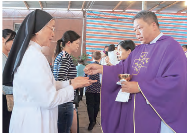
▲慈恩園清明追思彌撒每年都有逾500人參與，禮儀莊嚴溫馨。