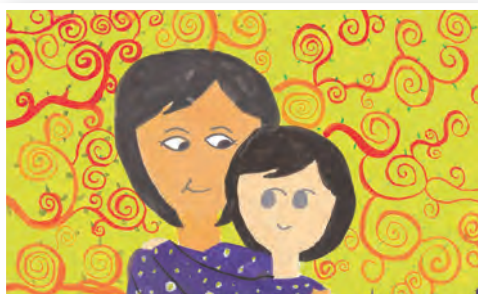
▲國小高年級組優選雲林的珈珈作品