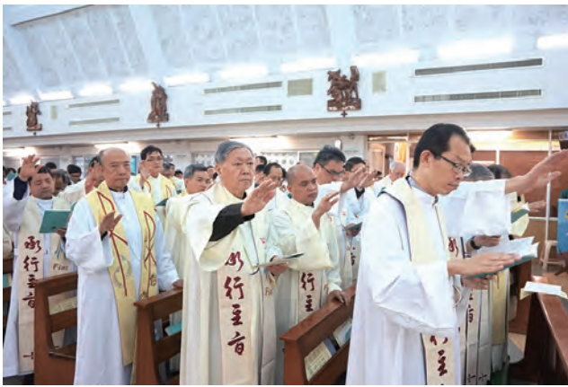
▲在祝聖聖油時，全體神父一起舉手恭念禱文。