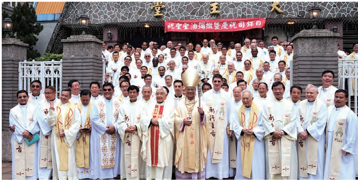
▲洪山川和狄剛兩位總主教與司鐸弟兄們慶祝自己的節日，在聖母無原罪主教座堂前歡喜大合照。

洪總主教說，神父首先是被揀選的人。《格林多後書》第4章第7節：我們是在瓦器中存有這寶貝，為彰顯那卓著的力量是屬於天主，並非出於我們。《宗徒大事錄》第9章15-16節：這是我所揀選的器皿……因為我要指示他，為我的名字該受多麼大的苦。被召的人擁有容易受傷的特質，《瑪竇福音》中耶穌要門徒如羊進入狼群，且「機警如蛇、純潔如鴿」，所以回應聖召也有易受傷的特徵。惟耶穌向多默展開肋旁，一個受傷的門徒碰觸耶穌的傷口，傷者的交談得見天父的慈悲。每個人都有自己的小墳墓，西滿伯鐸就是在得著耶穌的寬恕，育成祂成熟的信德，才能面對誘惑。這是聖召第二個特徵，感到自己被寬恕。我們雖然軟弱，在告解亭一個寬恕的人遇見一個將獲寬恕的心，得著屬主的寬恕