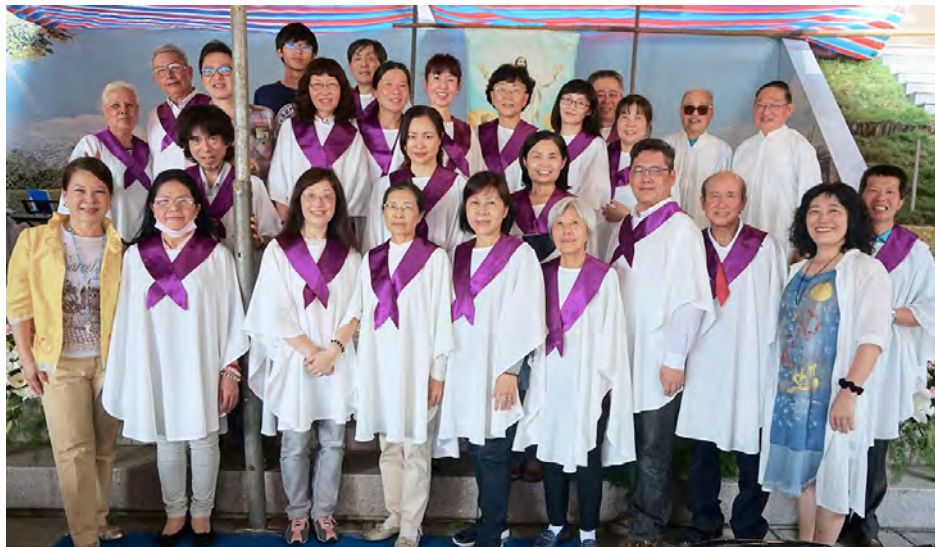
▲汐止天主堂每年為慈恩園追思彌撒音樂禮儀服事，表現可圈可點。