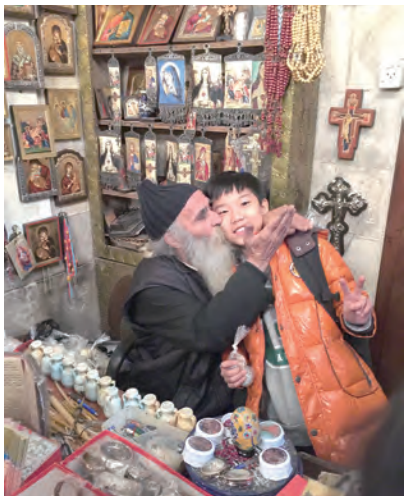
▲「雅各伯井」的神父爺與小輔祭，留下珍貴忘年情誼。

曾何時，對峙山影已將金黃吞噬殆盡。這才驚覺，此處天黑地暗，恐怕不是坐觀銀河星雨浪漫之境。即使力不從心、腳不聽命，總算在太陽落入地平線前，所有人都上了遊覽車，大家鬆了一口氣，只剩巴士電筒般的車燈，在曠野中，踽踽尋路、翼翼小心。車廂中好靜。