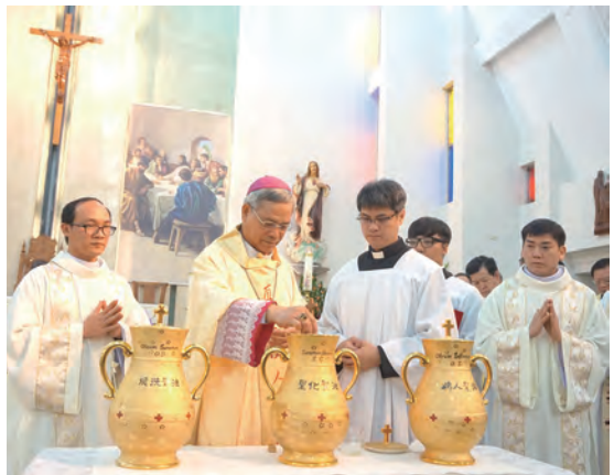
▲洪山川總主教攪拌聖化聖油，聖堂內馨香四溢。