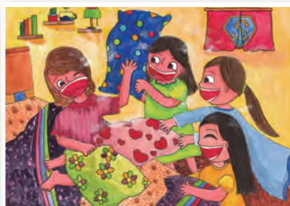
▲國中組特優小禎的作品