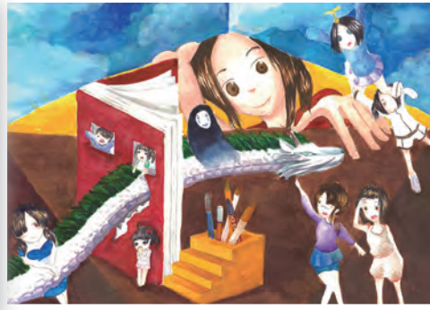
▲國中組特優台南荷荷作品