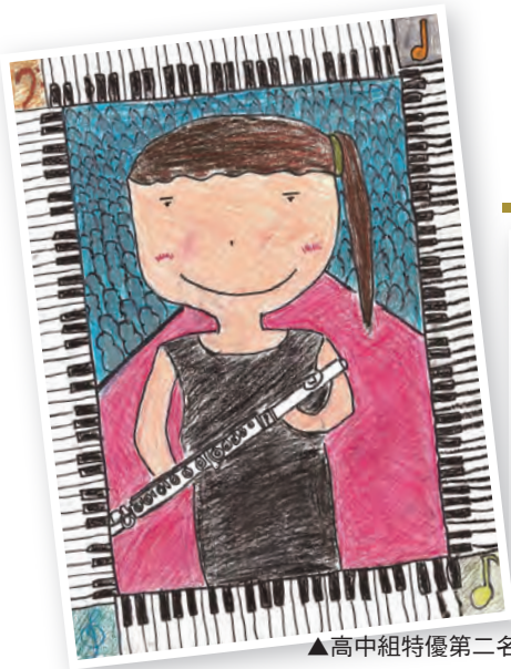
▲高中組特優第二名的小娟作品