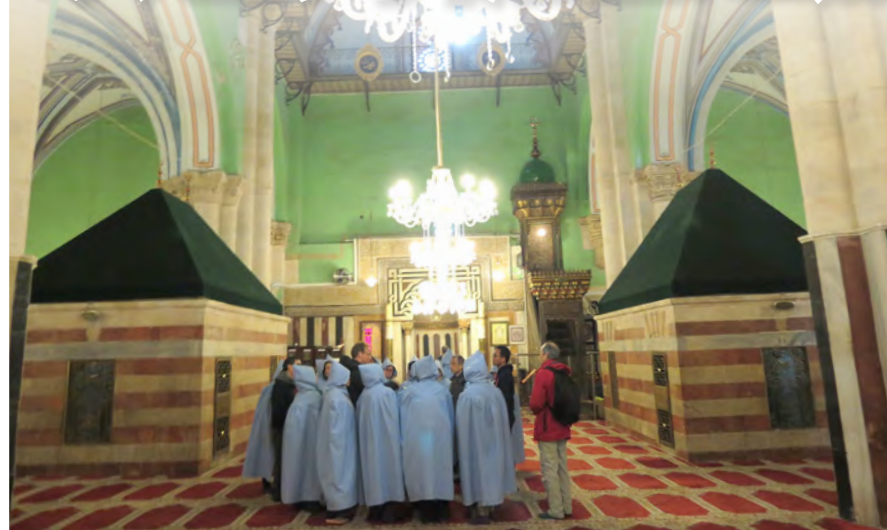
▲赫貝龍的族長墳墓