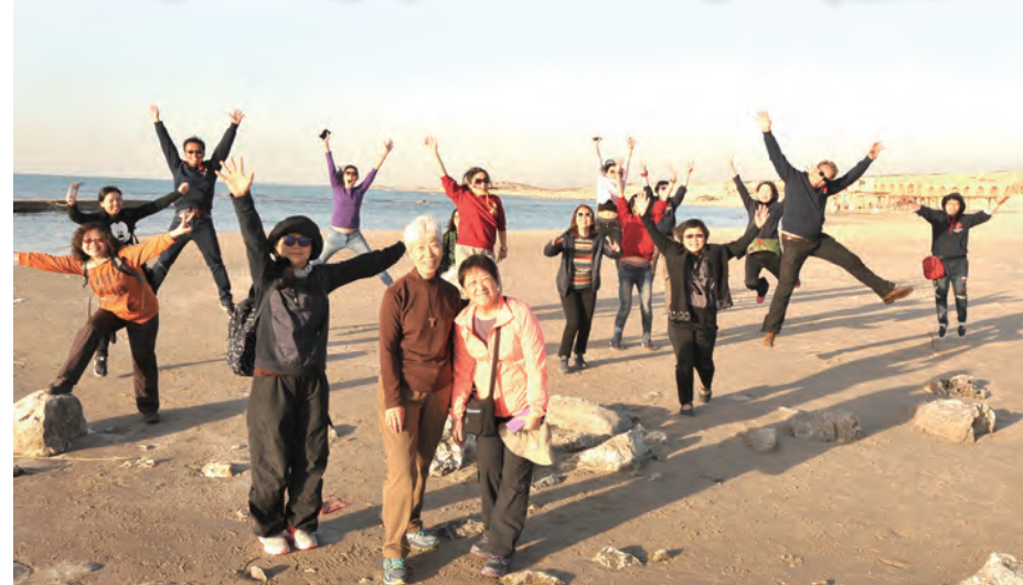
▲凱撒勒雅的海邊，團員們讚嘆天主的奇工妙化。