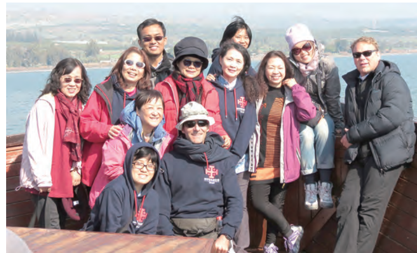
▲耶穌召叫捕魚的加里肋亞湖

車行至第一站Shivta，下車了，我們才發現還有一個主角被忽略了。風，只在我們趕緊裹上圍巾、拉上連帽，身懷絕技的Etienne神父矯健身影，早已一馬當先沒入那既像石堆、又像石牆，無一處完整成型、如迷宮般的廢墟之中。第一台感恩祭，全憑想像，我們佇立一座數千年前仍然巍峨壯麗、皇皇不可一世的至聖之所，而此刻此景則有：無法拒絕風的共祭、鳥鶯的嘎嘎聖詠即興演出，是一台天、地、人與自然合一的完美聖祭。而我嗅到一絲不妙：必須清醒了，不能任由時差作祟，還是趁早打消這但願稍稍接近「五星級觀光貴婦團行程」的念頭罷。