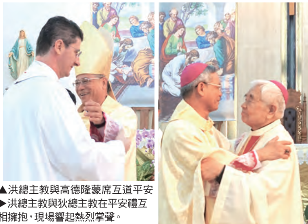
▲洪總主教與高德隆蒙席互道平安 ▲洪總主教與狄剛總主教在平安禮互相擁抱，現場響起熱烈掌聲。