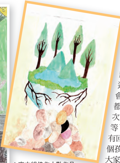
▲高中組佳作小勒作品

道：「雖然生活中有很多好朋友，但我認為最好的朋友是自己。每個人就像鑽石一樣，即使有殘缺；即使不完美，但若是認真聆聽自己內心的聲音，並更多充實自己，就能成為最獨特的鑽石。」