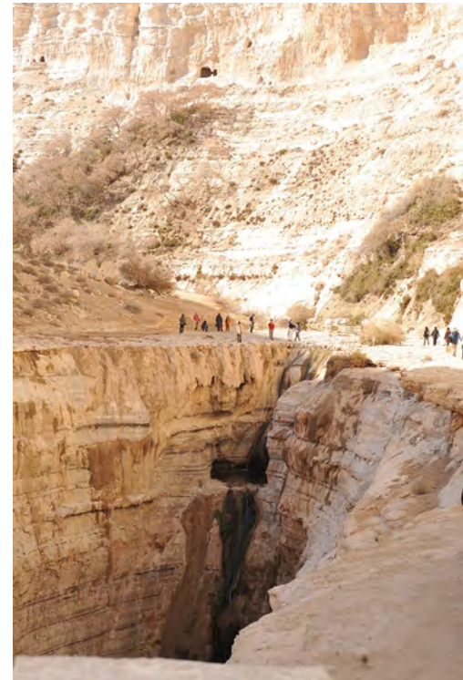
▲壁立千仞的Avedat 曠野，讓朝聖者感受深刻。