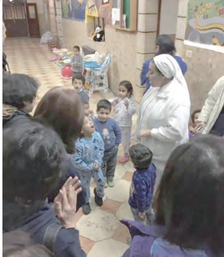
▲巴黎仁愛女修會所照顧的白冷孤兒院，令人份外感動。